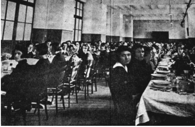
استانبول فیز معلم مکتبی طلبی صوفرادہ — 34 Luncheon in a Normal School for Girls

Maarif Albümü, İstanbul: Devlet Matbaası, 1928